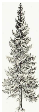
Świerk - ....