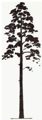
Sosna - .....

21. Dopasuj szyszki do drzewa. Wpisz literę przypisaną szyszce obok drzewa (w miejsce kropek) na którym wyrosła. (3 pkty)