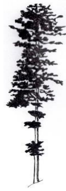
Jodła - ....